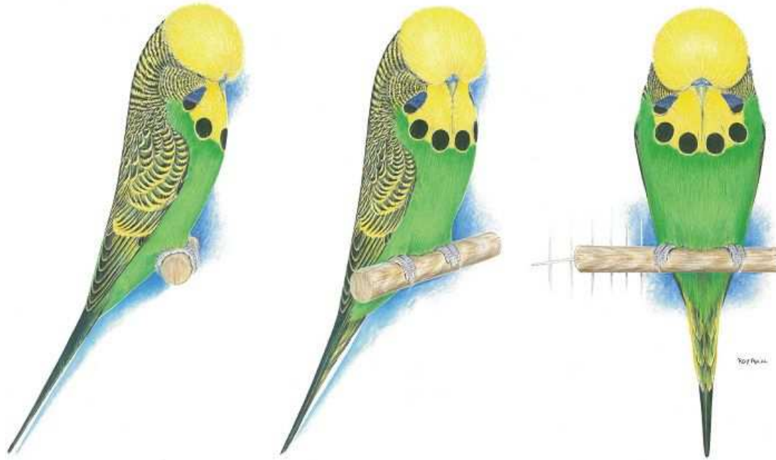
The Official WBO Pictorial Ideal